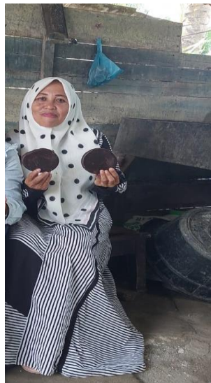
Sumber : Peneliti (2024)

Tahap evaluasi yaitu adalah sebuah proses ataupun tahapan yang dilihat dari adanya perkembangan yang dilakukan oleh Ibu rumah tangga terhadap kreativitas yang mereka tuangkan dalam oleh-oleh yang berbahan dasar gula merah kelapa selama masa pelatihan yang diberikan oleh peneliti. Tahapan ini juga adalah sebuah tahapan terakhir yang dimunculkan